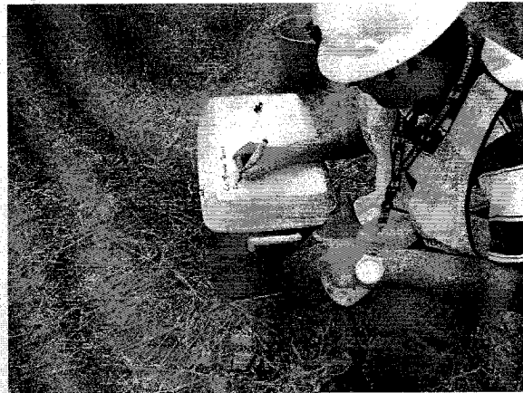
Imagen 3. Muestras listas para ser trasladadas. Imagen 4. Proceso de etiquetado de muestras.

En el día final de la visita, se sostuvieron reuniones con personal de la mina para tratar temas de interés respecto a los controles ambientales en las diferentes áreas de trabajo del proyecto y el accionar en conjunto de las instituciones del estado y levantar las actas respectivas por parte del Ministerio de Ambiente y Recursos Naturales.