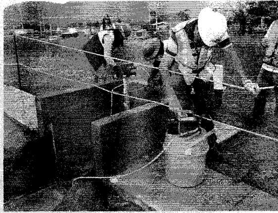
Imagen 1. Instalación de automuestreador.

Inicio el recorrido al día siguiente instalando el automuestreador en la descarga de la planta de tratamiento dentro del proyecto, se programó el mismo para tomar muestras cada tres horas como dicta el reglamento de “DESCARGAS Y REÚSO DE AGUAS RESIDUALES Y LA DISPOSICIÓN DE LOS LODOS”, acuerdo gubernativo 236-2006.