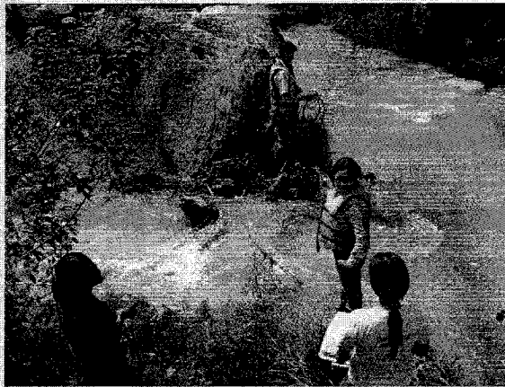
Imagen 2. Punto de monitoreo en intersección de dos ríos.

Posteriormente se realizó el recorrido a los puntos de muestreo aguas arriba y aguas debajo de la quebrada El Escobal y El Dorado para la toma de muestras respectivas, de forma simultánea, en otros puntos se tomaban muestras de agua potable por parte del ministerio de Salud en aldeas cercanas al proyecto.