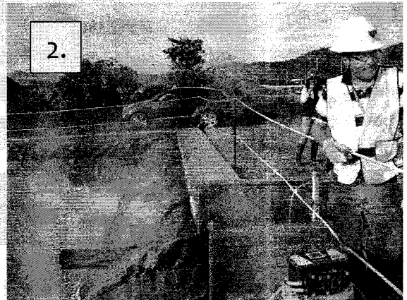
Fotografía 1 y 2. Instalación de equipo de muestreo en descarga de planta de tratamiento. Diagonal 17, 29-78 zona 11, (502) 2419-6464, www.mem.gob.gt